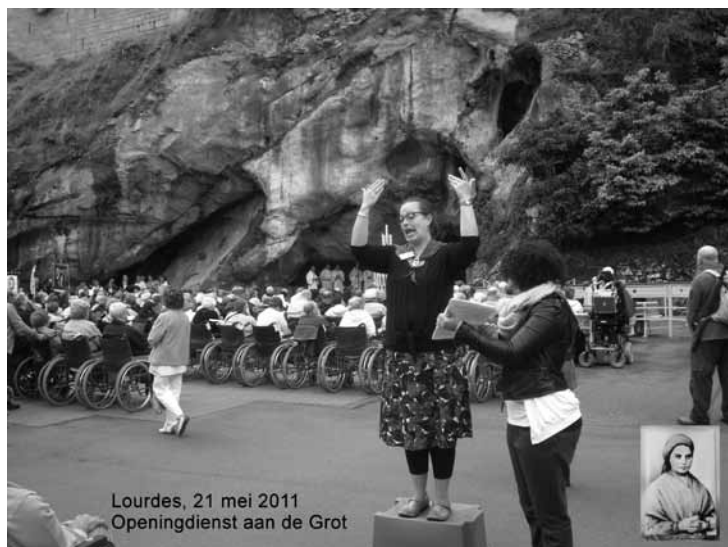
Lourdes, 21 mei 2011 Openingdienst aan de Grot

*Om dichterbij de leefwereld van Bernadette te komen maakte ik een eenzame rugzaktocht naar het dorpje Bartrés waar de schaapskooi van Bernadette een monument is. 'The Path of Bernadette' liet me een beetje voelen hoe zwaar voettochten in de hoge Pyreneeën zijn. Dat afzien was ook de bedoeling, maar helaas zat ik na een uurtje op een doodlopende weg. Met handen en voeten en het doofkaartje kon ik mijn teleurstelling aan een, in een tuin werkende, beroepsmilitair uitleggen, deze man aarzelde maar even..., zwaaide een: 'kom maar mee' en wees me op het boodschappenautootje in de oprijlaan. Zo kwam ik na een tien minuten zoeven door de nauwe straatjes van Hoog-Lourdes weer op het echte 'Path of Bernadette'.