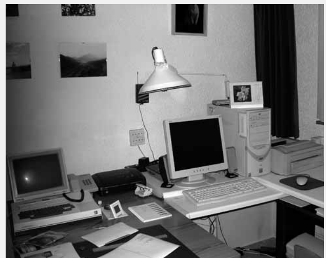
teksttelefoon – telefoon – fax – pc – printer